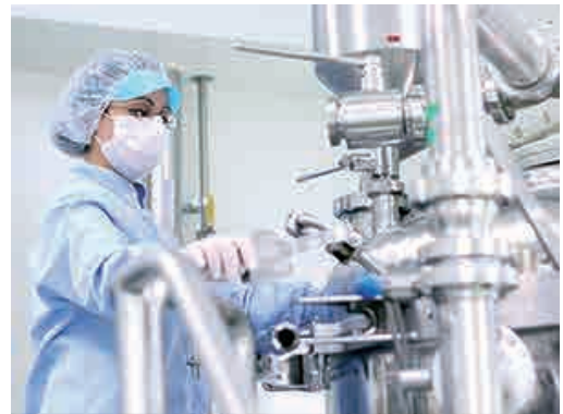
高度なクリーンルームにも対応可能

冬季凍結の可能性のある地域の屋外ポンプ、モーターの保温に有効です。設置場所、温度域により、内外装材、断熱材を選定します。現地採寸により、最適なジャケット仕様をご提案いたします。